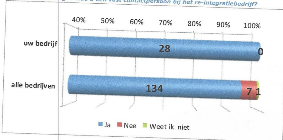
Grafiek n.a.v. vraag 4: Had u een vast contactpersoon bij het re-integratiebedrijf?

Alle cliënten hadden een vast contactpersoon bij Eigenkans.